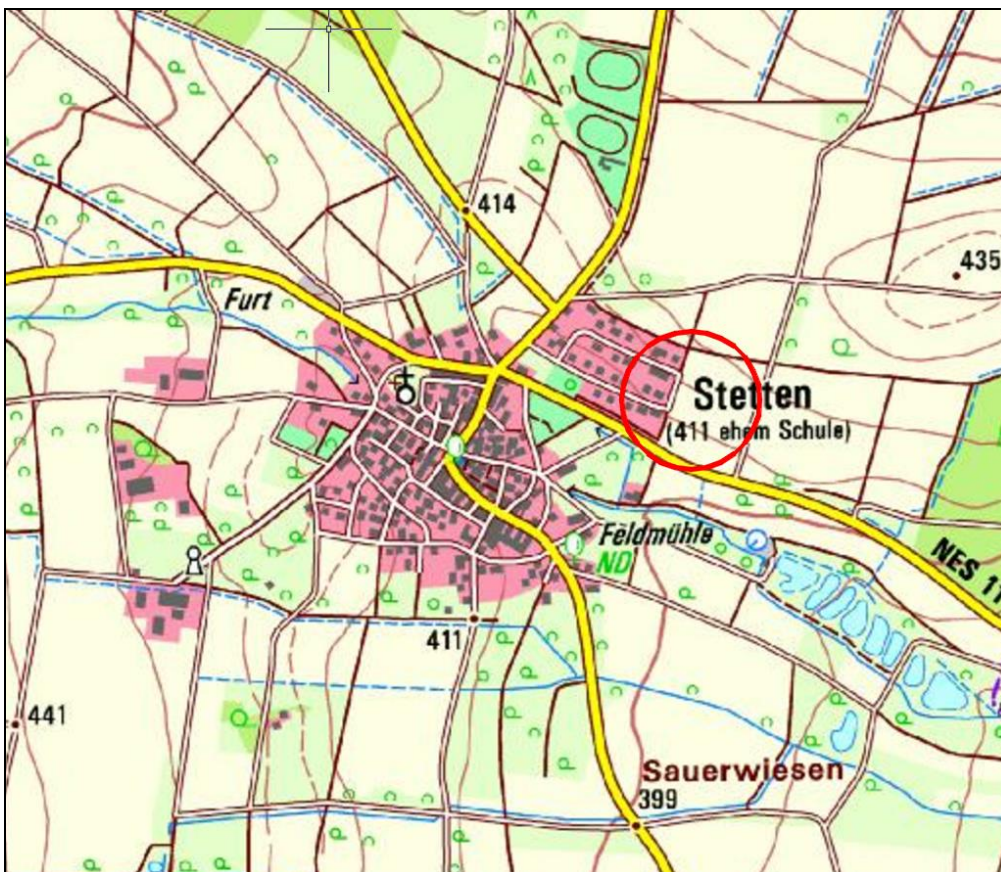
Lageplanausschnitt ohne Maßstab

Der Änderungsbereich liegt im Naturpark „Bayerische Rhön“, aber außerhalb des Landschaftsschutzgebietes.