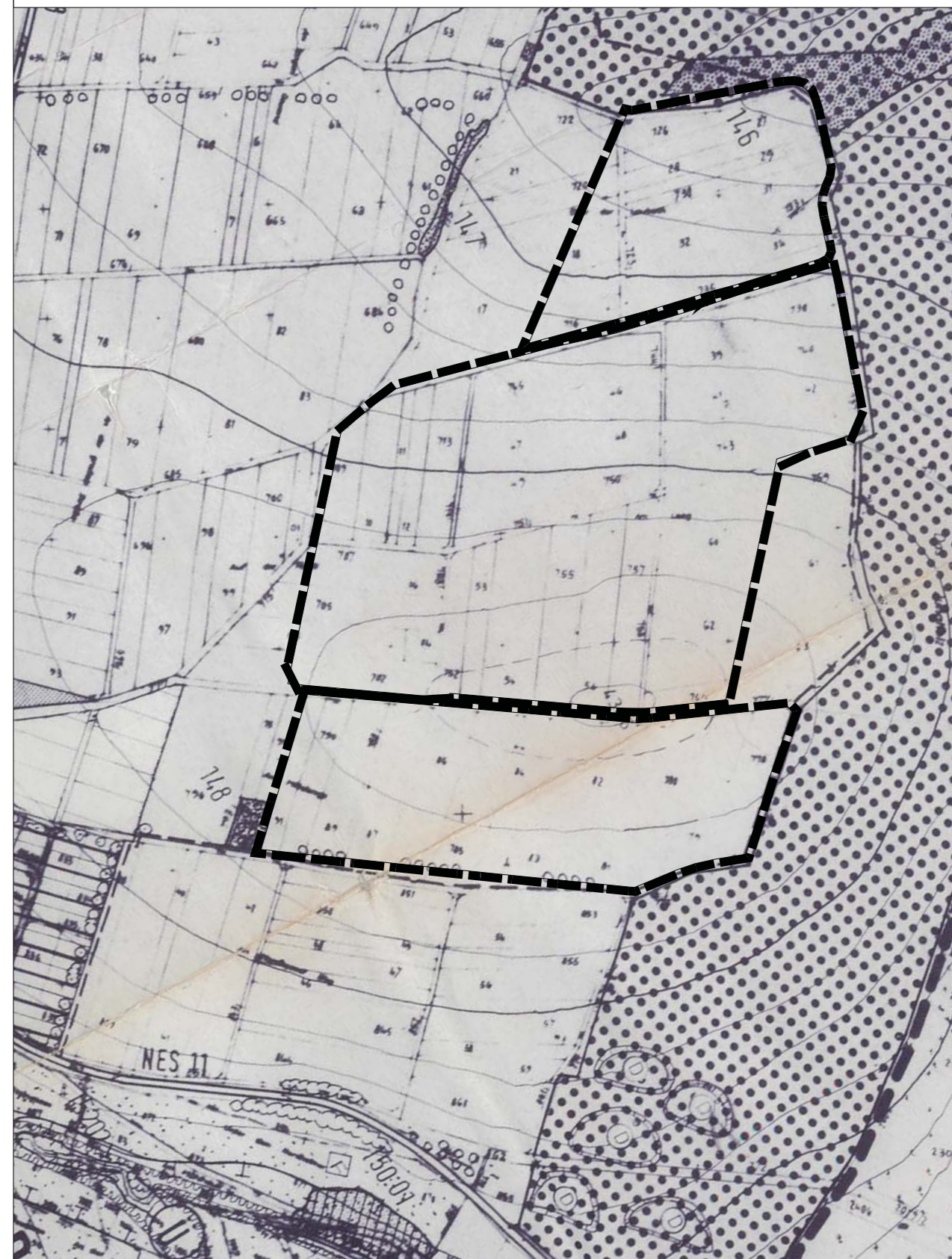
Kartengrundlage: Flächennutzungsplan (Scan)